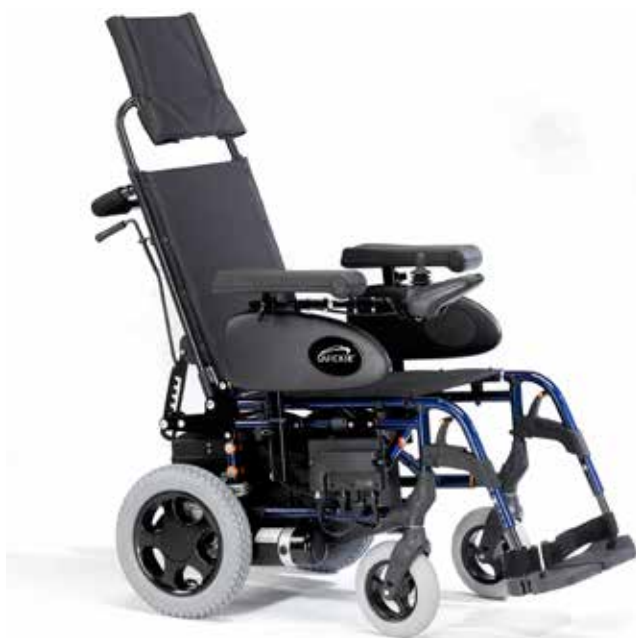
Modello con schienale reclinabile